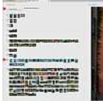
Foto's van schijven

Picasa is op zich niet zo handig bij het werken met je scanner, maar verlost je wel van de noodzaak om erg precies te werken omdat je de ruwe scans daarna keurig kunt bijwerken.