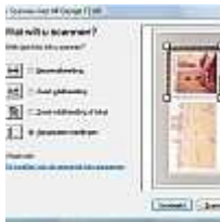
Foto's van scanner

Picasa is op zich niet zo handig bij het werken met je scanner, maar verlost je wel van de noodzaak om erg precies te werken omdat je de ruwe scans daarna keurig kunt bijwerken.