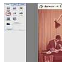
Ik doe een gok

Flitsen levert vaak rode ogen op, maar Picasa kan ze bijna automatisch weer "normaal" maken. Indien storend moet dat je eerste correctie zijn.